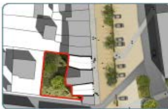
Mutualiser les jardins de 2 maisons vacantes pour créer un jardin partagé public