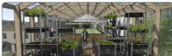
Créer un centre de formation et de recherche en maraîchage biologique et cultures hors-sol