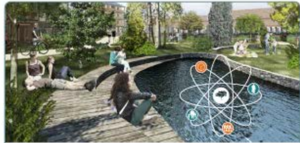
Réaménager le jardin Chabrier en préservant les arbres, lui donnant de nouveaux usages , une nouvelle image (pédagogie environnementale et démarche sociale)