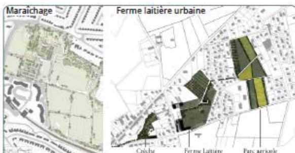
Intégrer une production agricole dans un quartier résidentiel