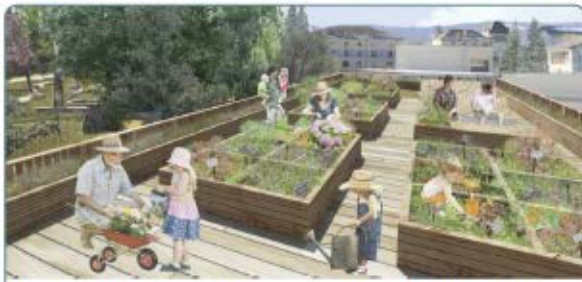
Proposer des potagers partagés sur une toiture-terrasse