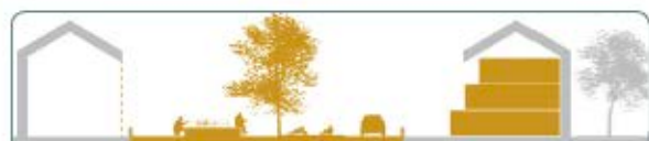
Rétrécir l'emprise de voirie et modifier les seuils des maisons dans la rue d'un lotissement pour y intégrer des jardins partagés