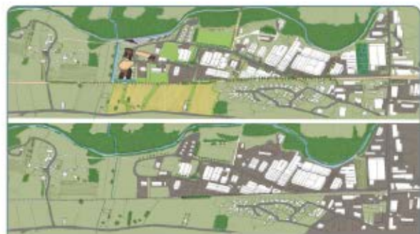
Associer industrie et agriculture